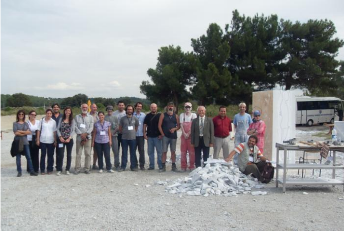
Foto:1 ÇOMÜ, GSF Düzenleme Kurulu, Çanakkale Belediyesi Ekibi ve Sanatçılar bir arada çalıştay alanında.

Çalıştayı teması “Çanakkale Değerleri”dir. Yazının başlığında yaptığım göndermeden de hissedileceği gibi heykeller, her sanatçıya verilmiş olan 3m küplük mermer bloklardan yontularak ortaya çıkarılmaktadır. Sanatçılar belirlenen temaya göre figüratif eserler şekillendireceklerdir. Çalıştay halka açık yürütüldüğünden, sanatla ve heykel ile ilgilenen sanatseverler Dardanos yerleşkesinde süreci izleyebilir, sanatçılarla tanışabilirler.